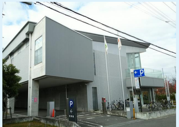
JR学研都市線「住道」駅より徒歩20分